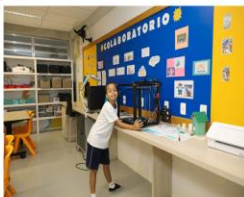
GET Elza Soares – acervo SME